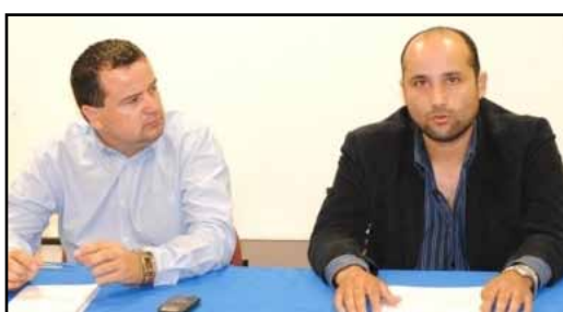
Cesa la PGJE a un MP y 2 secretarios de acuerdos de Tijuana y Tecate