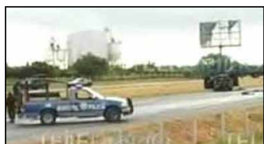
Nuevo enfrentamiento entre soldados y sicarios deja otros cinco muertos en Nuevo León