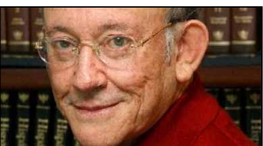
Fallece Germán Dehesa

Directivos del periódico Noroeste en Mazatlán denunciaron que la misma voz que los extorsionó vía telefónica, antes del ataque a balazos de la madrugada del miércoles a sus instalaciones, exigió 200 mil pesos con la amenaza de hacer explotar el edificio