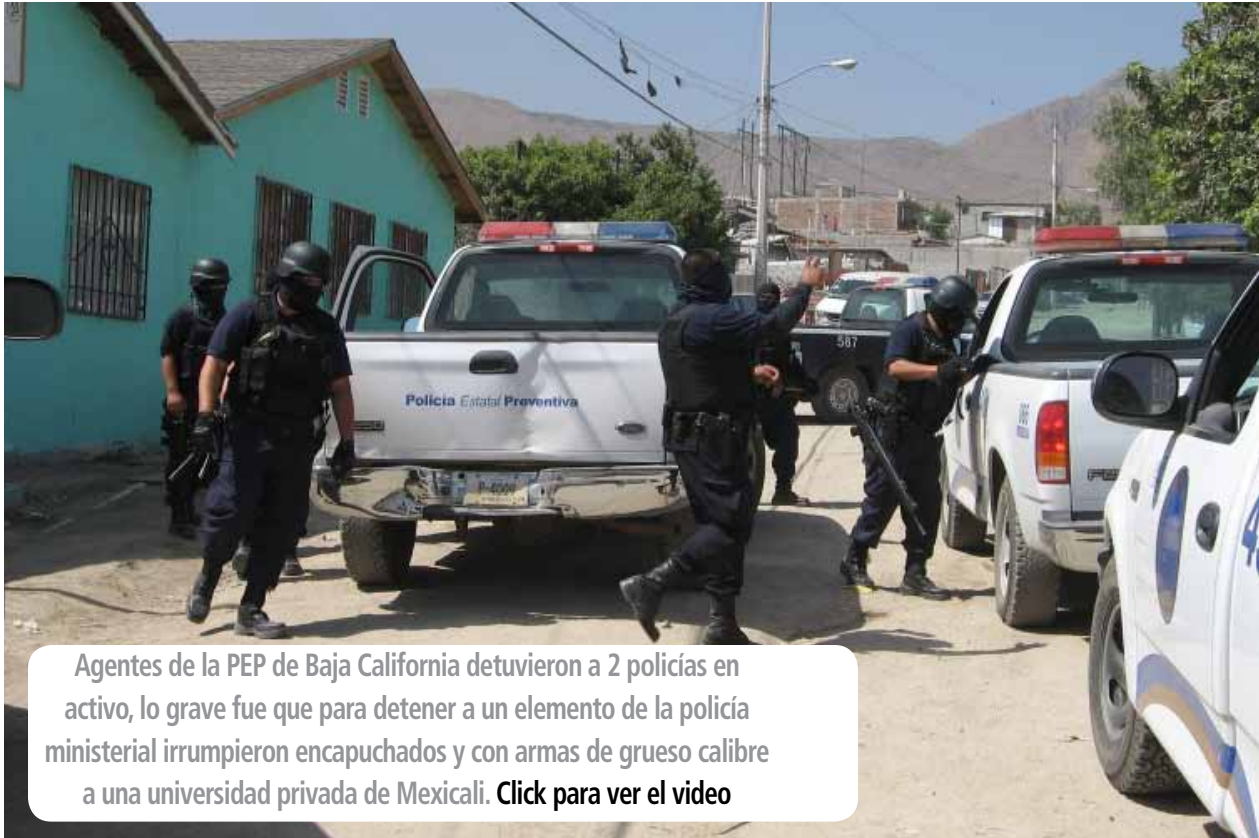
Agentes de la PEP de Baja California detuvieron a 2 policías en activo, lo grave fue que para detener a un elemento de la policía ministerial irrumpieron encapuchados y con armas de grueso calibre a una universidad privada de Mexicali. Click para ver el video

de ésta para quedar en su posición final dentro del predio de la casa 386, parcialmente por debate del frente derecho de la patrulla 324.